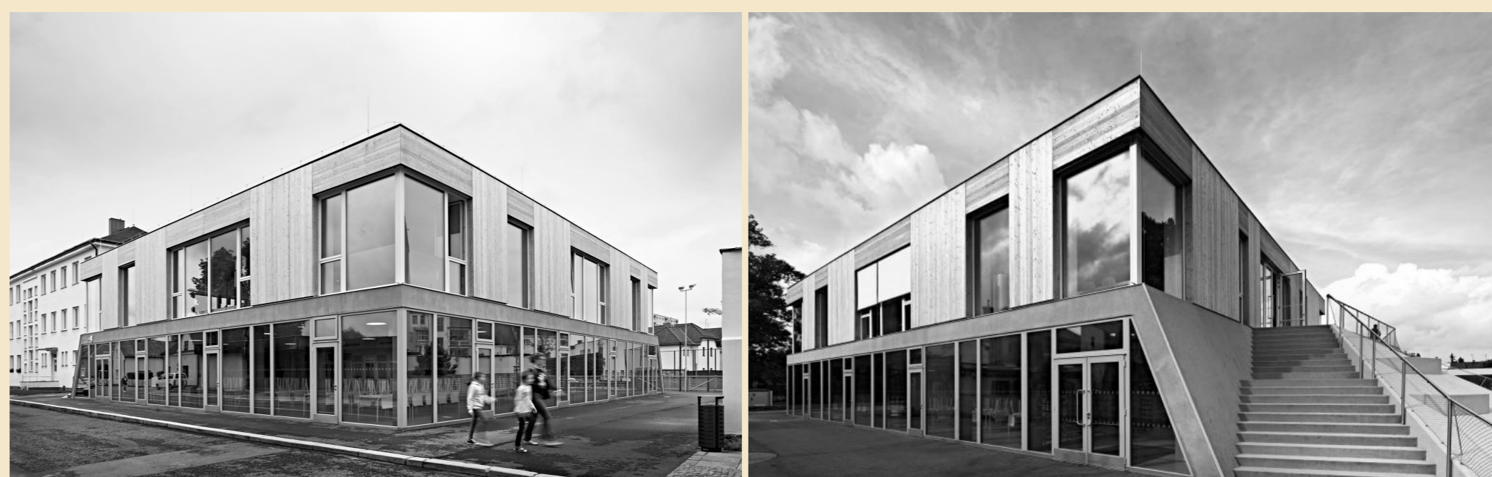
Komunitní centrum Mírová, Mnichovo Hradiště, PROJEKTIL ARCHITEKTI