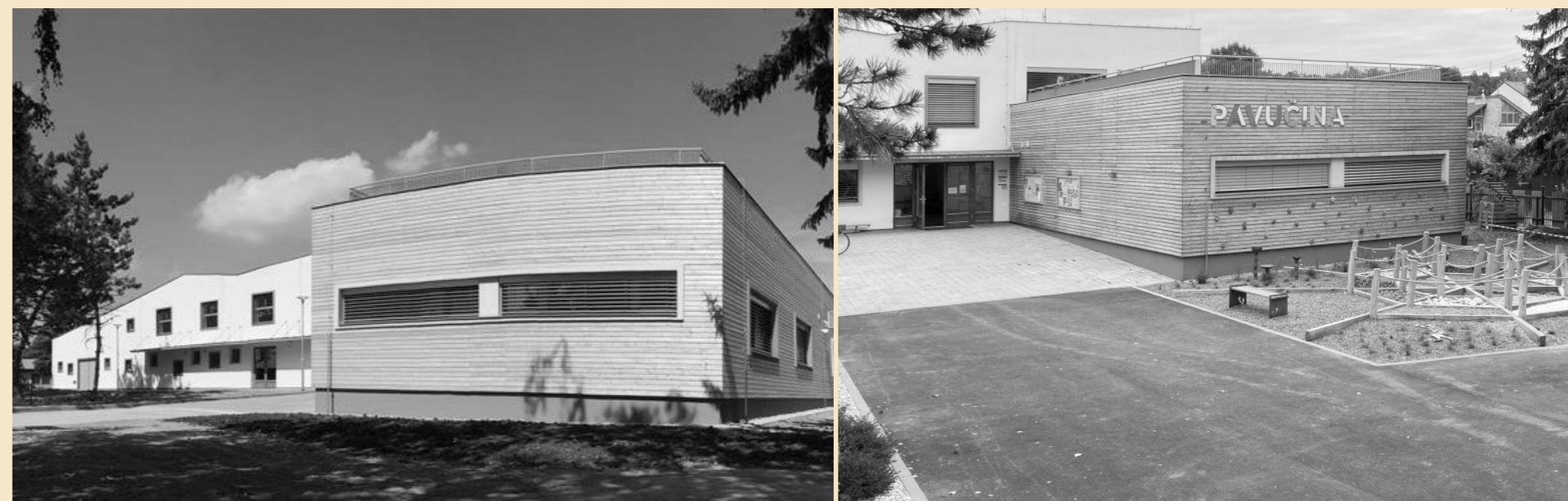
Polyfunkční komunitní centrum Pavučina, Hustopeče