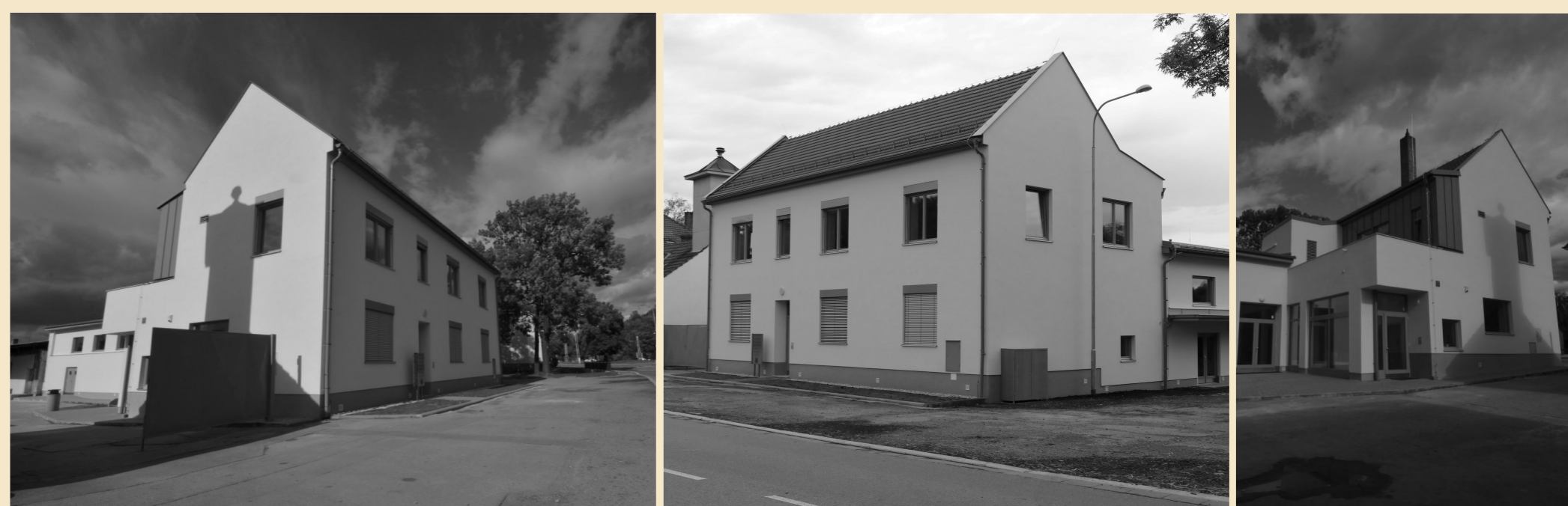
Polyfunkční komunitní centrum Skalice, PAMREKO s.r.o., stavební firma