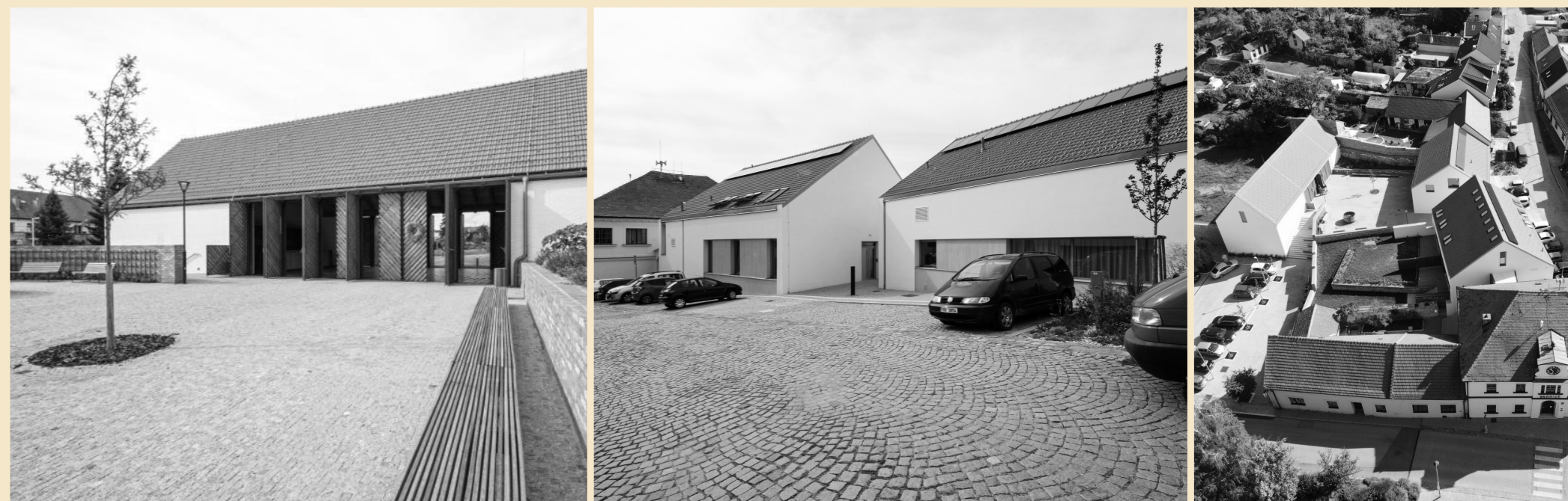
Komunitní centrum Židlochovice, JURA ET CONSORTES / Pavel Jura, Pavel Steuer