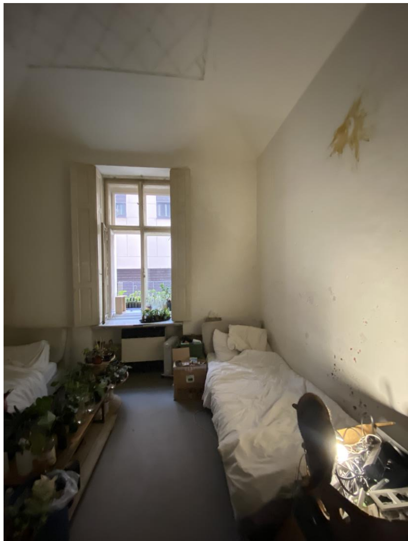
Vlastní fotodokumentace bytu před rekonstrukcí, ulice Ostrovní, Praha 1