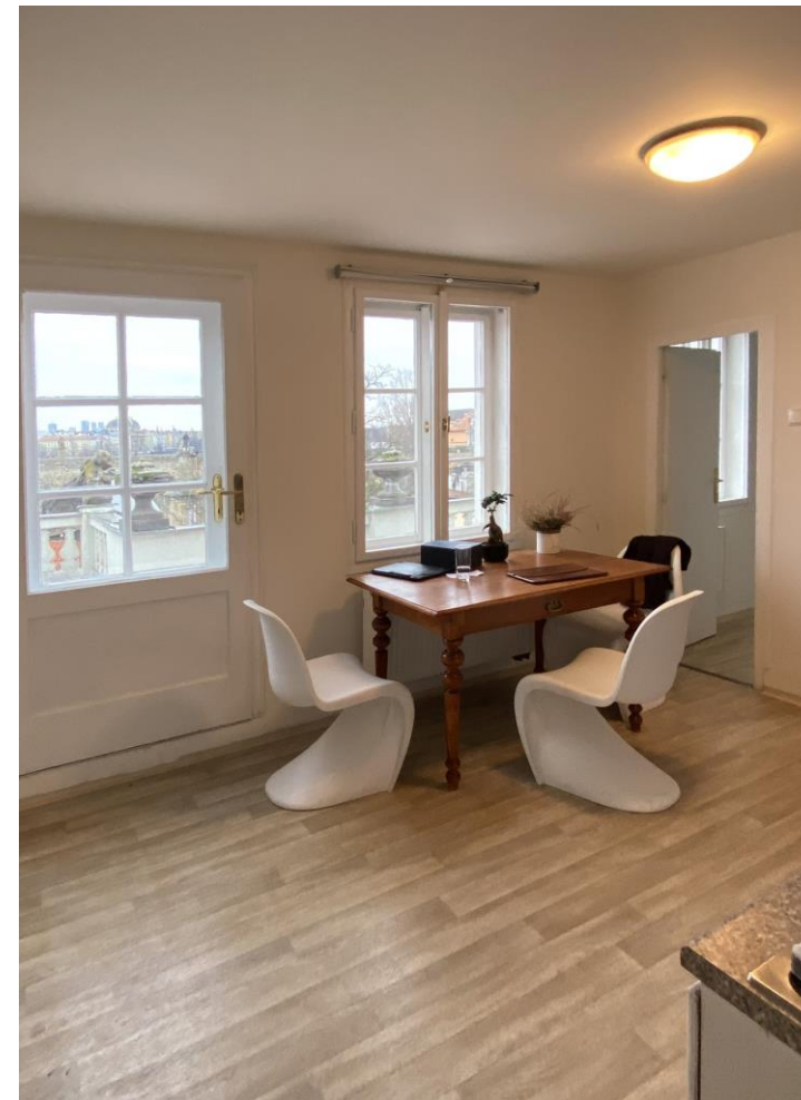
byt U Lužického semináře Praha 1 – zděděný stůl