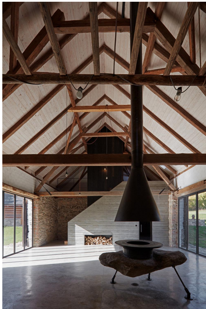
Lenka Míková – Dva domy, srnky a stromy, ČR, foto: boysplaynice