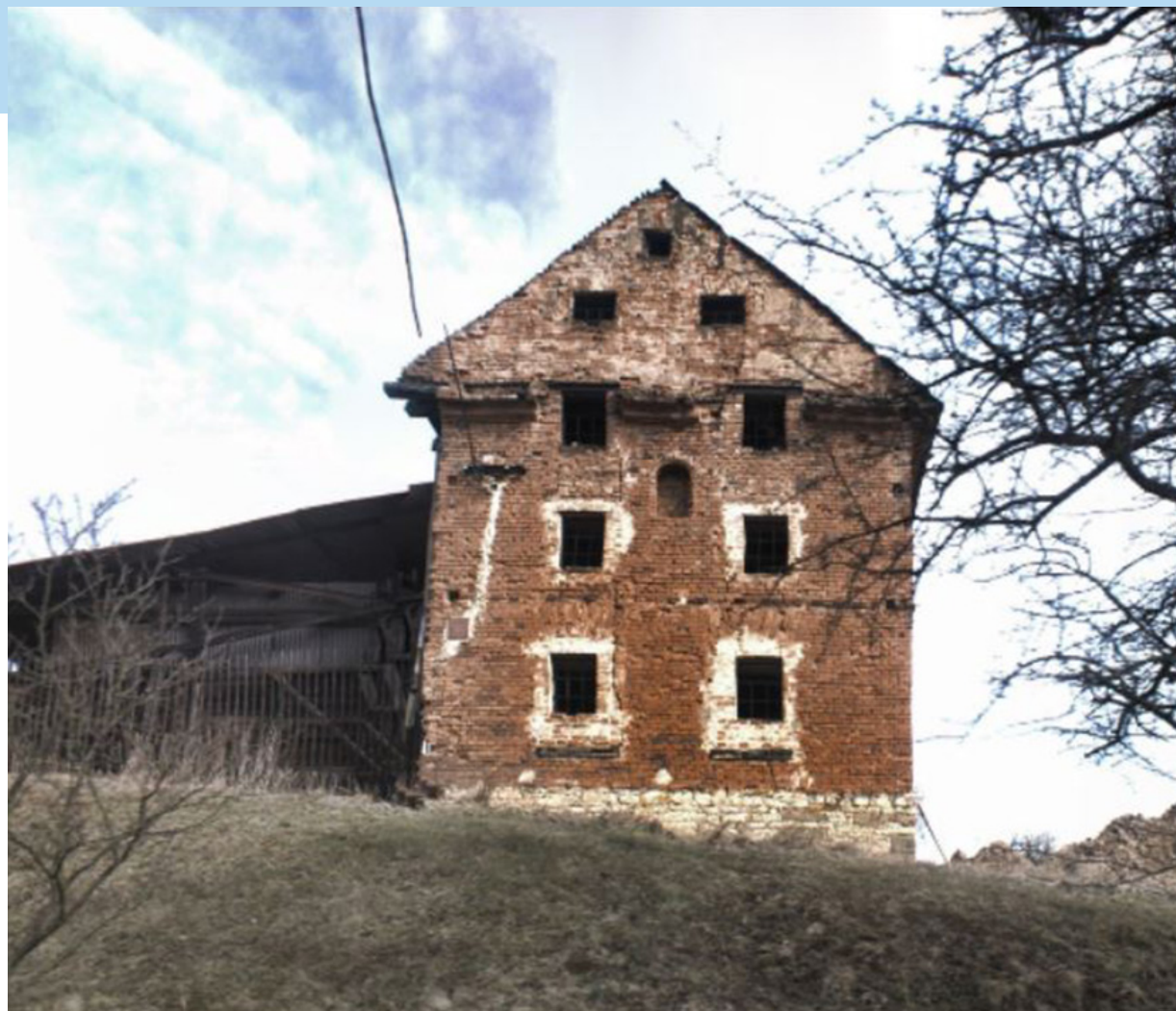
▲ Dům v ruině (Zadní Arnoštov). Nákladná rekonstrukce od studia ORA vytváří dojem, že nové zásahy byly vloženy do ruiny, tak jak ji architekti na pozemku našli. Autoři se ale snažili vymazat změny z doby socialismu, což je patrné při podrobném zkoumání historických snímků.