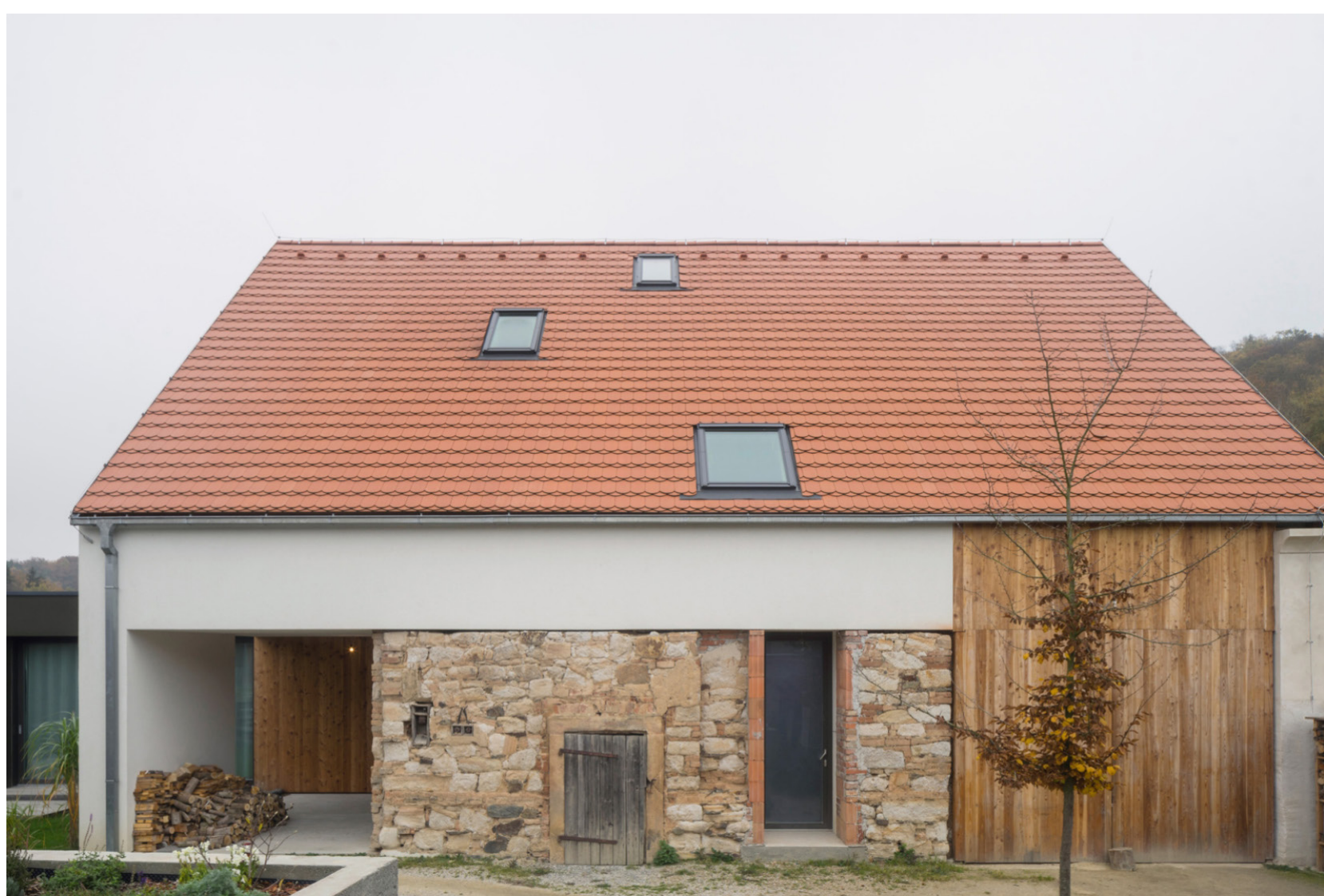
▲ Přestavba hospodářského dvora Bukovec (projectstudio8). Fotografie z oficiální prezentace (vlevo) v porovnání se stavem v roce 2022. Fragment kamenné zdi byl omítnut tradiční technikou. Toto řešení je méně násilné než prezentace obnaženého zdiva, zachovává autenticitu původní stavby, a přesto zůstává kontrast s novou konstrukcí.