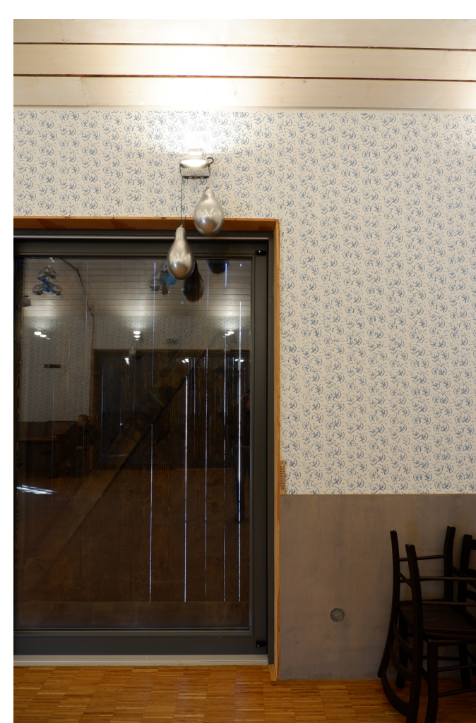
▲ Obecní dům ve Skaličce vytváří nové centrum obce. Chybějící náves nahrazuje prostor inspirovaný dvorem statku.